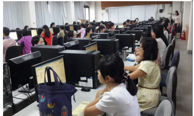
填報系統線上操作