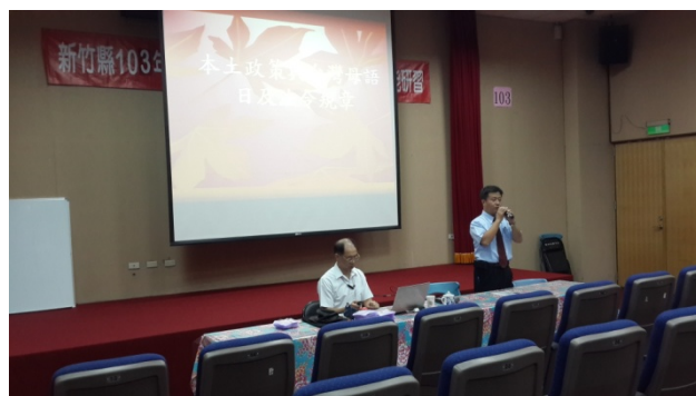
承辦學校校長致詞