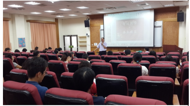
有效教學、多元評量、補救教學與本土語言教學