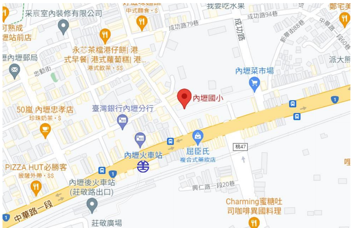
▲ 桃園市內壢國小-地理位置圖